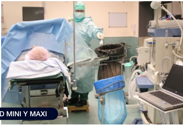
STAND MINI Y MAXI