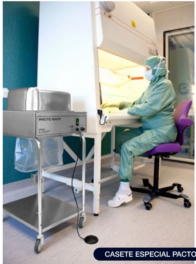
CASETE ESPECIAL PACTOSAFE