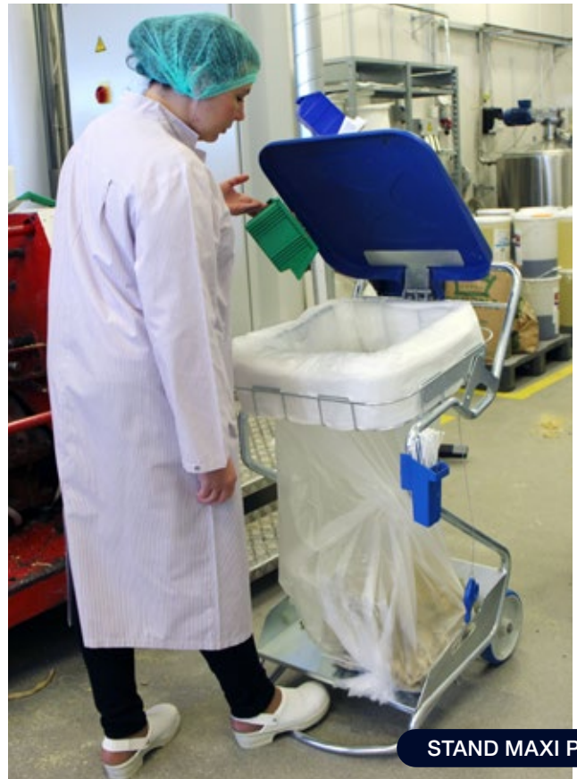
STAND MAXI PEDAL