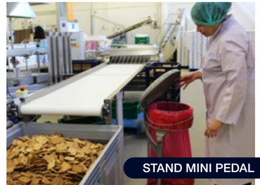
STAND MINI PEDAL