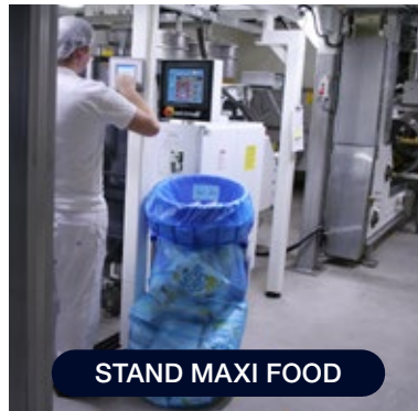
STAND MAXI FOOD